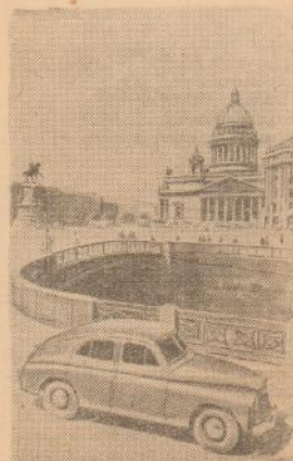
Ленинград. На Исаакиевской площади.

Крупнейший в Белоруссии комбинат металлических изделий сооружается на окраине Могилева. Первая очередь комбината уже вступила в строй. Отвоенный выпуск посуды и фурнитуры.