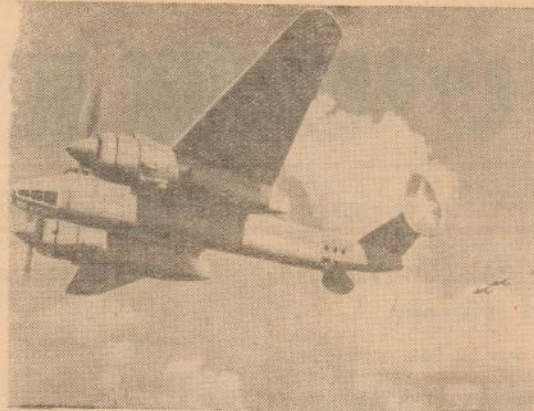
Скоростной бомбардировщик в полете.