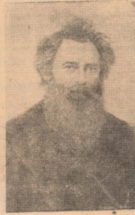
Иван Иванович Шишкин (в 1861 году в семье купца. Девятидцати лет Шишкин поступил в казанскую гимназию, но увлекся ри-