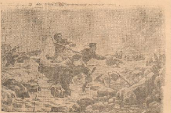
Художественная выставка, посвященная 30-летию Советской Армии, в Государственном музее изобразительных искусств имени А. С. Пушкина. На снимке: «Десант на Курильских островах». Репродукция с картины художника А. И. Плотнова.

В порядке подготовки к призыву всему призывному контингенту нужно еще больше совершенствовать свои знания и практические навыки по военной и физической подготовке и стать достойными воинами Советской Армии. П. Койстинин.