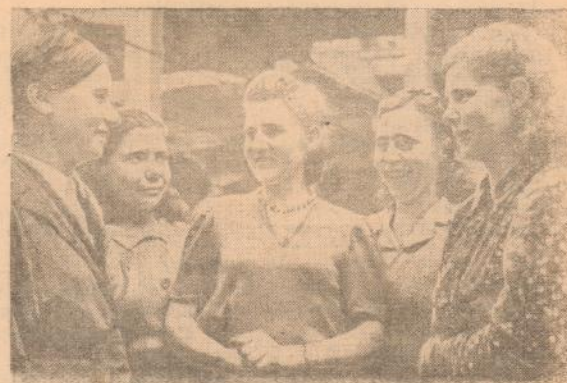
Ленинград. Карбюраторный завод имени Куйбышева, работа без государственной дотации, дал за семь месяцев 3200 тысяч рублей прибыли.

Готовится новая партия тканей для отправки в другие угольные районы страны.