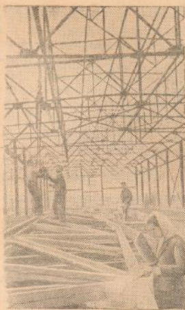
На строительстве Львовского автосборочного завода.