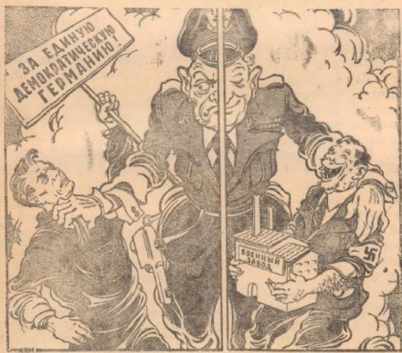
Денацификация по-американски: правая рука знает, что творит левая. Рис. К. Теодоровича.

крупных животных. Другой пищи в достаточном количестве они получить не могли. Шкуры этих животных они разрезали осколками кремня и свежесвали их, чтобы добраться до мяса. Эти осколки заменили обезьянам котти и хищнические зубы, которых у них не было.