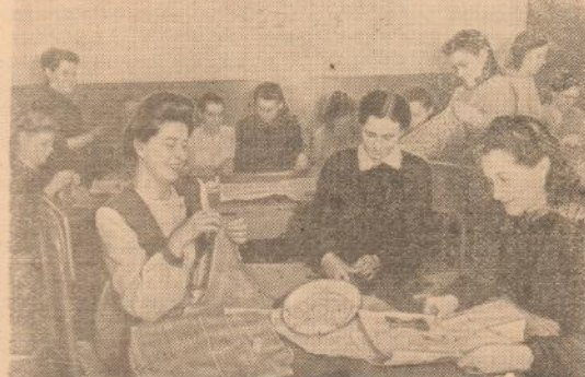
При клубе имени Горбунова (Казань) несколько лет существует кружок художественной вышивки, кройки и шитья. Организованный советом жен-общественниц члены кружка принимают активное участие в благоустройстве рабочих общежитий, шефствуют над детскими учреждениями.

КАЛИНИН, 2. На Бежцком заводе сельскохозяйственного машиностроения началось массовое производство конной льномолотилки «МЛ-7». Новая машина, сконструированная инженером М. С. Латышевым, в 4 раза производительнее существующей льномолотилки «здки». Выход семян при молотбе достигает у нее 97—98 процентов, в то время как машина «здки» дает не более 60 процентов.