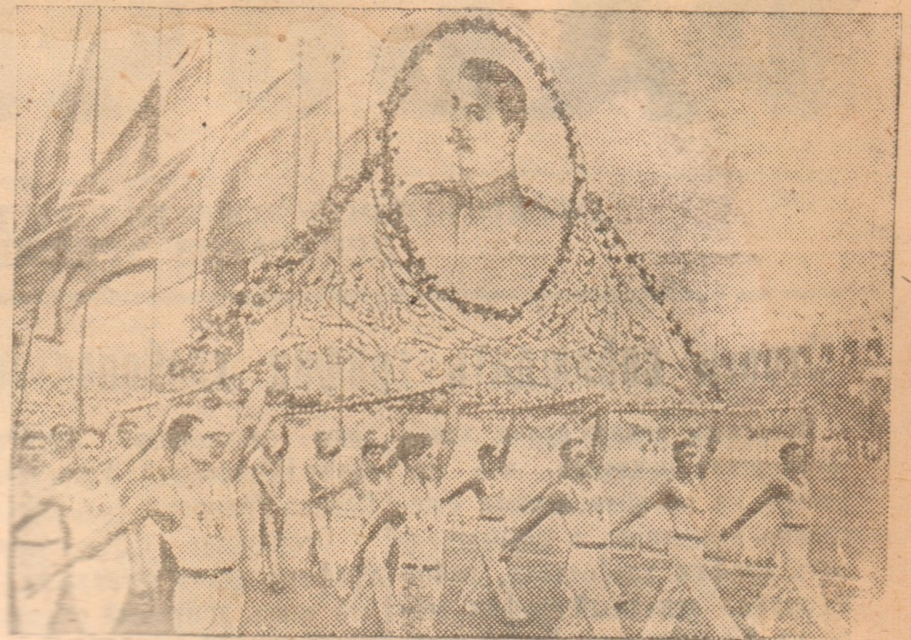
Всесоюзный физкультурный парад на московском стадионе «Динамо» 20 июля 1947 года. На снимке: проходит колонна Армянской ССР.

20 июля — день парада. В этот день мы были возбуждены с утра, готовили костюмы, повторяли упражнения. Стадион «Динамо» стал центром всеобщего внимания.