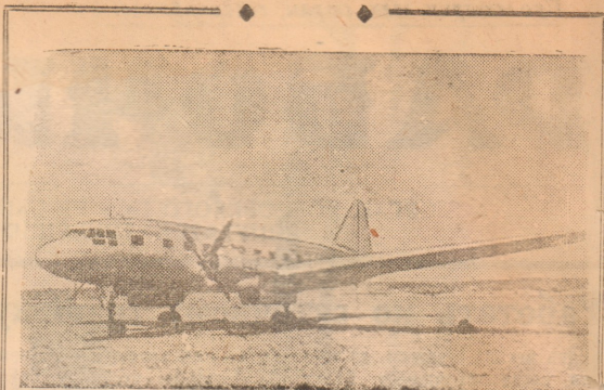
Пассажирские двухмоторные самолеты «Ильюшин-12» обслуживают дальние беспосадочные полеты между Москвой и другими городами нашей страны. Новый советский самолет имеет 27 удобных пассажирских кресел.

Все это известно председателю правления тов. Паршину, но он не обращает внимания на беспорядочность. Смирится он, и с таким положением, что конюхи больше занимаются своими домашними делами и на основную работу выходят