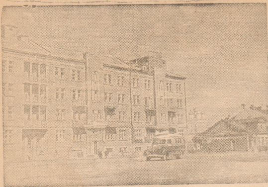
Древний город Псков, разрушенный немецкими варварами, воз- рождается из руин. В городе восстановлено много жилых домов. На снимке: восстановленный жилой дом на Рижском шоссе.