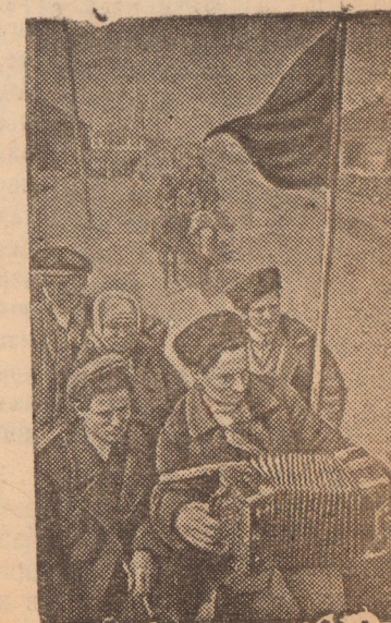
Колхозники Орджоникидзевского края едут на строительство канала.

25 апреля 1940 года началось скоростное строительство Невинномысского канала. Канал строится колхозниками Орджоникидзевского и Краснодарского краев, Ростовской области и Калмыцкой АССР.