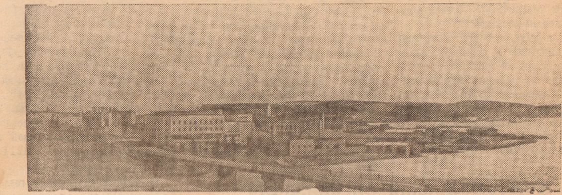
По городам Советского Союза.

В своем постановлении коллегия Наркомзема Союза обязала земельные органы, директоров МТС и руководителей колхозов своевременно организовать борьбу с сельскохозяйственными вредителями, особенно по сахарной свекле, хлопку, льну и масличным культурам, а в районах Северного Кавказа и Украины — с черепашкой. (ТАСС).