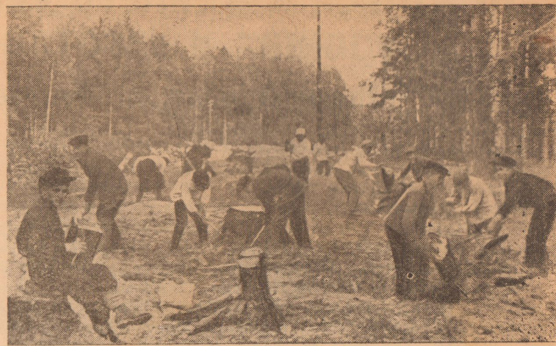
Молодежная бригада колхоза «Передовик», Красногирвского сельсовета, на корчевке пней.