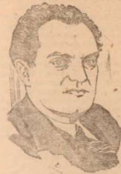
Валерия Владимирович Куйбышев (родился 6 июня 1888 г., умер 25 января 1935 г.).

волюционный марш или песню сибирских ваторжников. Громять не позволяли. Холодно, неприятно, невесело... — Зачем поют печальные песни, хорошо бы спеть веселую, бодрую, — говорит Валерия своему соседу. Гей, друзья! Вновь жизнь покидает, Слышны вешески здесь и там. С нею радость мнится к нам. Радость жизни, радость битвы Пусть умчат унылые следы... Эту песню рубик начал один из молодых арестованных. Валерия повертывается к нему, удивленно и радостно спрашивает: — Откуда ты знаешь мое стихотворение? — Его вся наша молодежь знает, — отвечает тот. То была песня, в свое время написанная Куйбышевым в ссылке. Куйбышев и в ссылках не покидал жизнерадостности и веры в победу пролетарской революции.