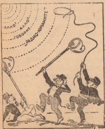
Тщетные усилия. Рисунок В. Лесевича.

В Воронеже на областных полугодовых курсах медицинских сестер занимаются без отрыва от производства 52 человека.