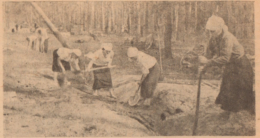
На снимке: женская молодежная бригада Красногиривского сельсовета на подготовке трассы дороги.