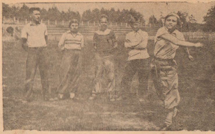
На снимке: физкультурники тренируются в метании диска.

На стадионе спортивного общества завода имени Киркиж.