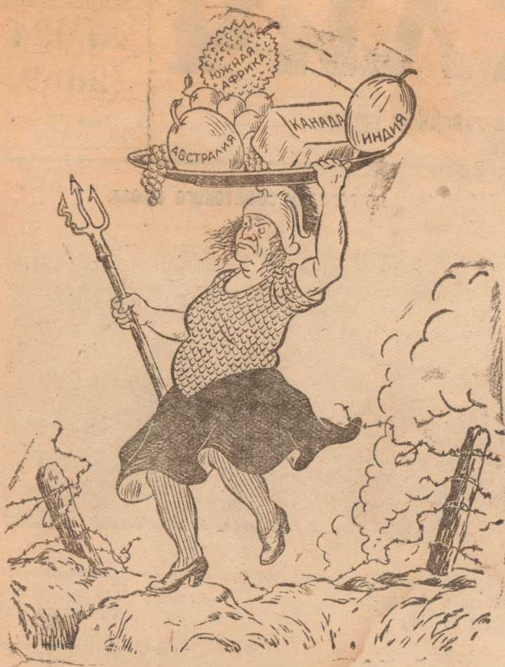
Британская империя на ухабах войны.