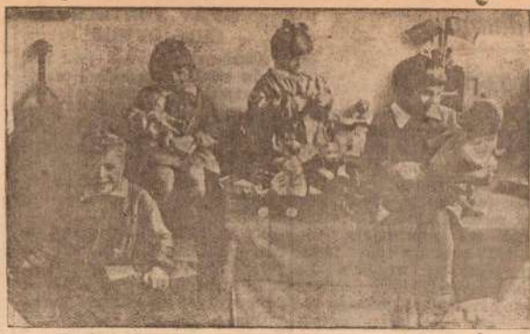
В детском саду, им. 12 декабря (завод имени Куркина). На снимке: дети за игрушками.

ствует также отчет, распространявшийся газетой «Вайок джурнал» в крупном центре резной промышленности — городе Эри. 88 процентов лиц, ответивших на вопросы, поставленные в отчете, высказались против оказания помощи белофиннам. В Голливуде местный профсоюз музыкальных работников отклонил предложение о пожертвовании 400 долларов в фонд государственного комитета помощи белофиннам. (ТАСС).