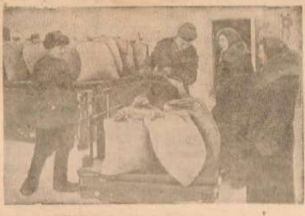
Семья колхозника Стройтовой, заводчицы 1523 трудодней, получает зерно.

Колхоз «12 Октября» (Урюпинский район Сталинградской области) — один из передовых колхозов области, устроивший кандидатом на ВСХВ в 1940 г. (широким показом). В 1939 г. колхоз получил урожай зерновых 13,2 центнера с га и пасенкушка 12,5 центнера. Из трудодней выдано работникам по 5 р. 50 к., зерном по 8,5 килограммам, растительного масла по 200 грамм, овсяной по 2 кг.