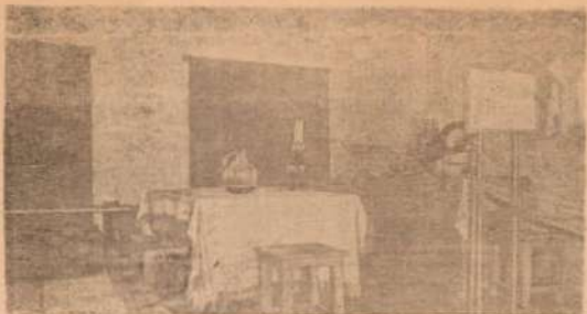
В г. Гори (Грузинская ССР) в доме, где родился и провело свое детство И. В. Сталин, открыт музей. Дом полностью реставрирован и приведен в тот вид, какой он имел полвека назад. На снимке: Комната, в которой родился и жил И. В. Сталин.

Сейчас Ивановский областной архив подготавливает к этой исторической дате большую художественно-оформленную выставку. Выставка будет иметь следующие разделы: «Экономические и политические предпосылки рабочего движения»; «Десятое января и его отражение на революционном Иваново-Вознесенске»; «Летняя Стачка и образование Совета рабочих депутатов»; «Роль РСДРП в руководстве рабочим движением»; «Расстрел рабочих на Талде». В качестве иллюстраций будет выставлено более ста подлинных документов, которые ярко рассказывают о правовом положении рабочих, заработной плате, системе штрафов, жилищных условиях, майской конференции РСДРП, требованиях рабочих и т. д. (ИнтАСС).