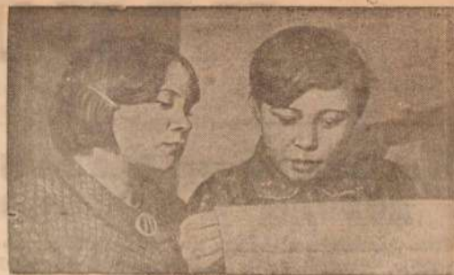
Малые народности Севера — эвры, ханты и другие...