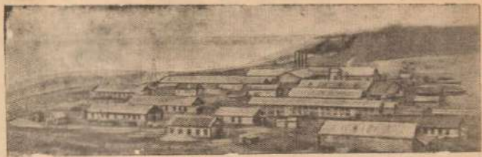
Рыбоконсервный завод № 3 Озюнинского рыбокомбината (Усть-Байкальская район, Намчатская область).