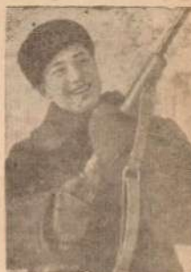
В Петрозаводске состоялся героический оборонный соревнование артиллерийских по стрельбе, метанию гранат и лыжи.

Брошюра является прекрасным и очень важным пособием. (ТАСС).