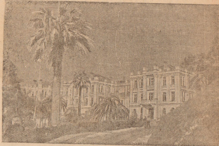
Санаторий имени Ленина в Гульрипше (Абхазская АССР).