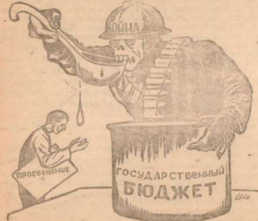
«Распределение» средств Государственного бюджета в Англии и Франции. Рис. Н. Миссонов.

Партийная и профессиональная организация фабрики «Детские» выдвинула за оживление клубной работы. 21 февраля в клубе был организован концерт. 23 февраля силами дружины была поставлена шпеса «Пограничники», руководителем которой тов. Зиньков. Де начала спектакля рабочие прослушали доклад о 22 годовщине Красной Армии. Нужно пожелать чтобы заправилось это хорошее начинание. Н. Лебедев.