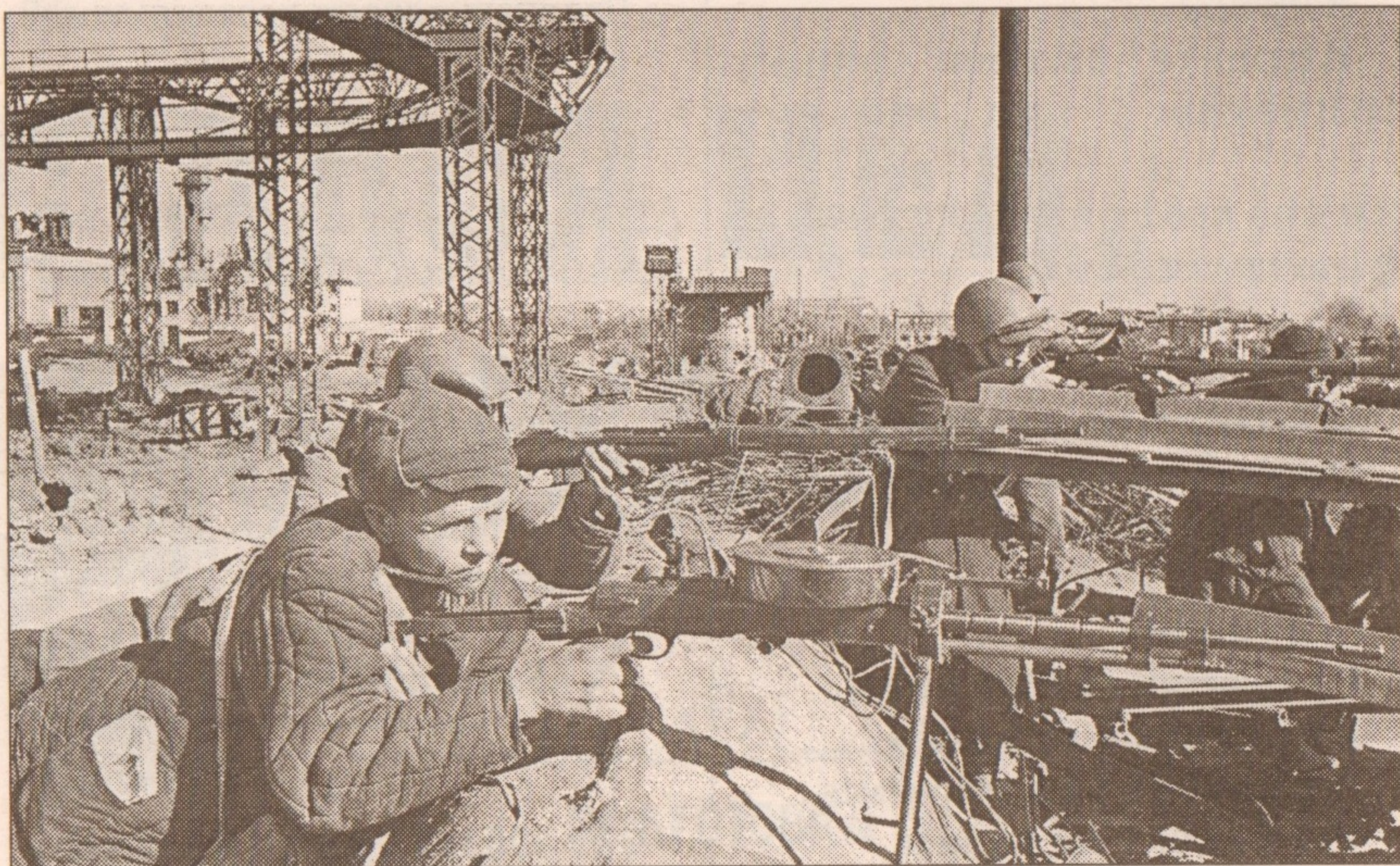
Советские бойцы, не зная ни сна, ни отдыха, часто ценой собственной жизни защищали родную землю от ненавистного врага. 1941 г.

10. Назовите самый страшный для Сталинграда день. (23 августа