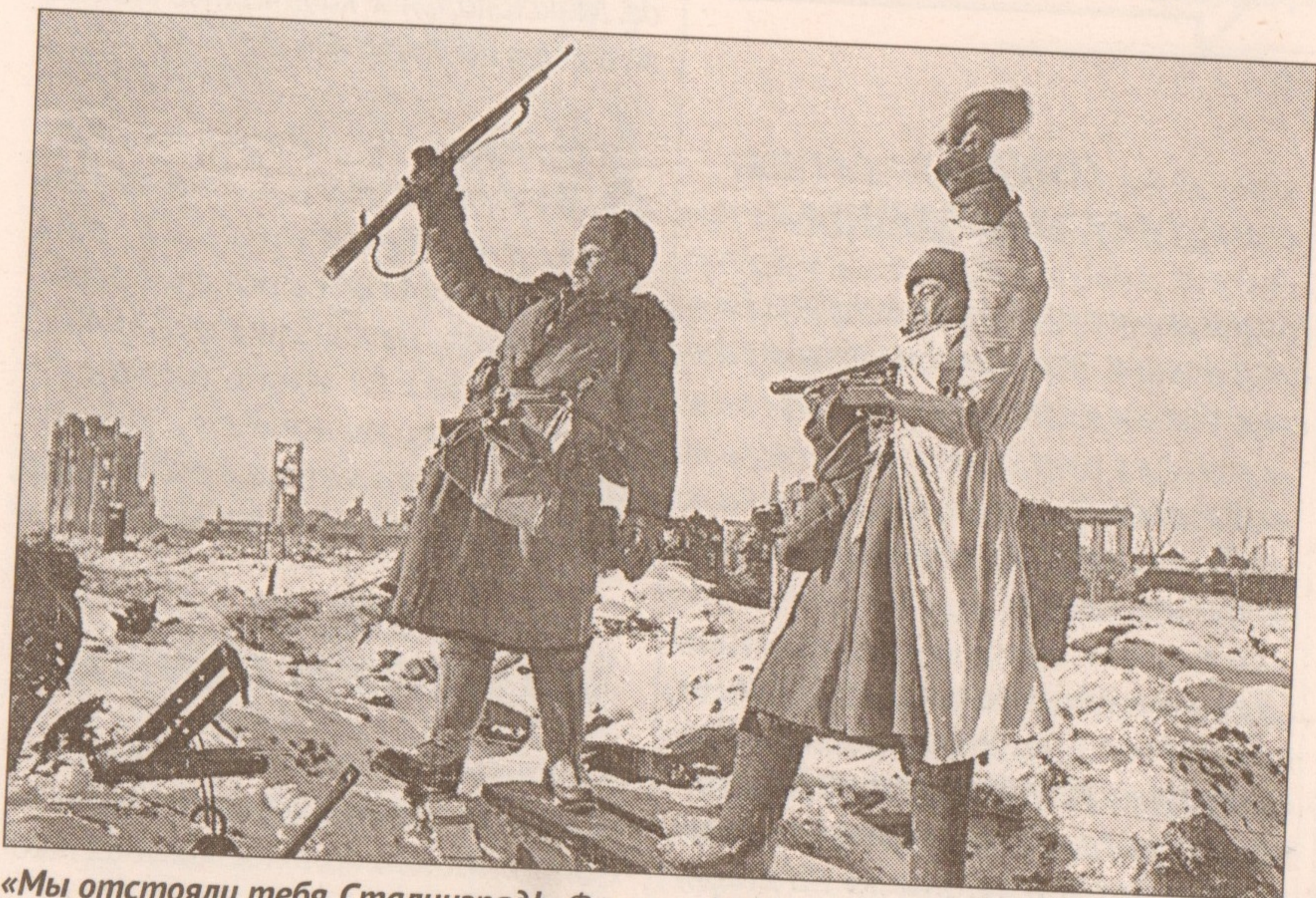
«Мы отстояли тебя, Сталинград!» Февраль 1943 г.

(Победители под аплодисменты выходят на сцену. Проводится награждение, как вариант — вручение грамот или медалей.)