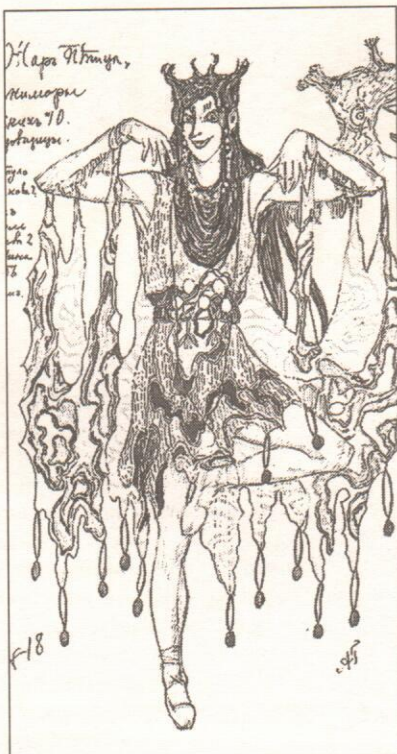
Не все представляли Кикимору как страшную злую старуху! Юной и озорной увидел её художник А.А. Головин в балете «Жар-птица». 1910 г.

КИКИМОРА (смотрит, куда показывает Домовёнок): Нет, Егорка. Это собачий след. У нас тут иногда дачники со своими питомцами гуляют. Нам с Лешим это не очень нравится — собаки