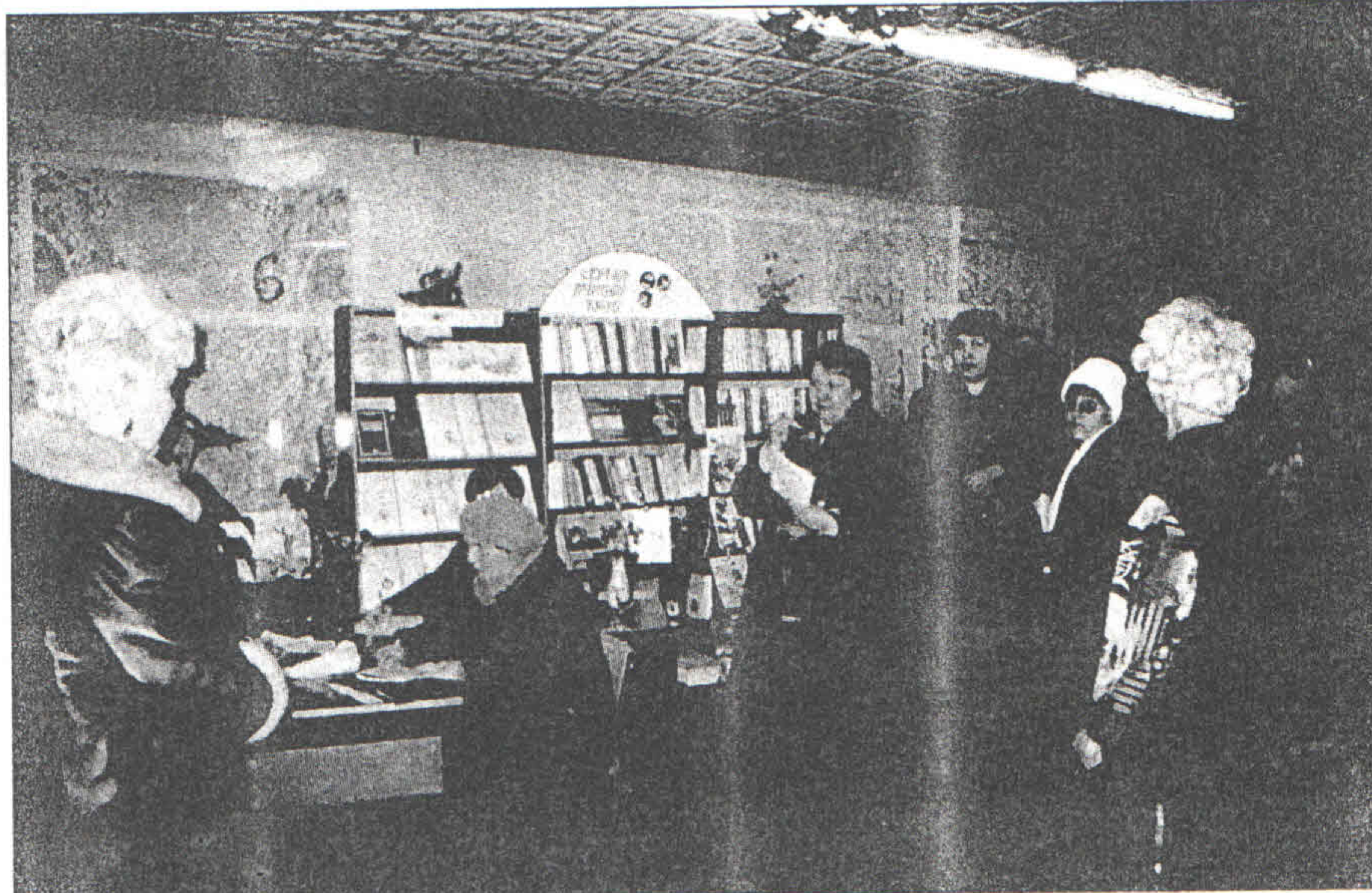
Гости из пяти регионов знакомятся с работой сельских библиотек Ковровского района