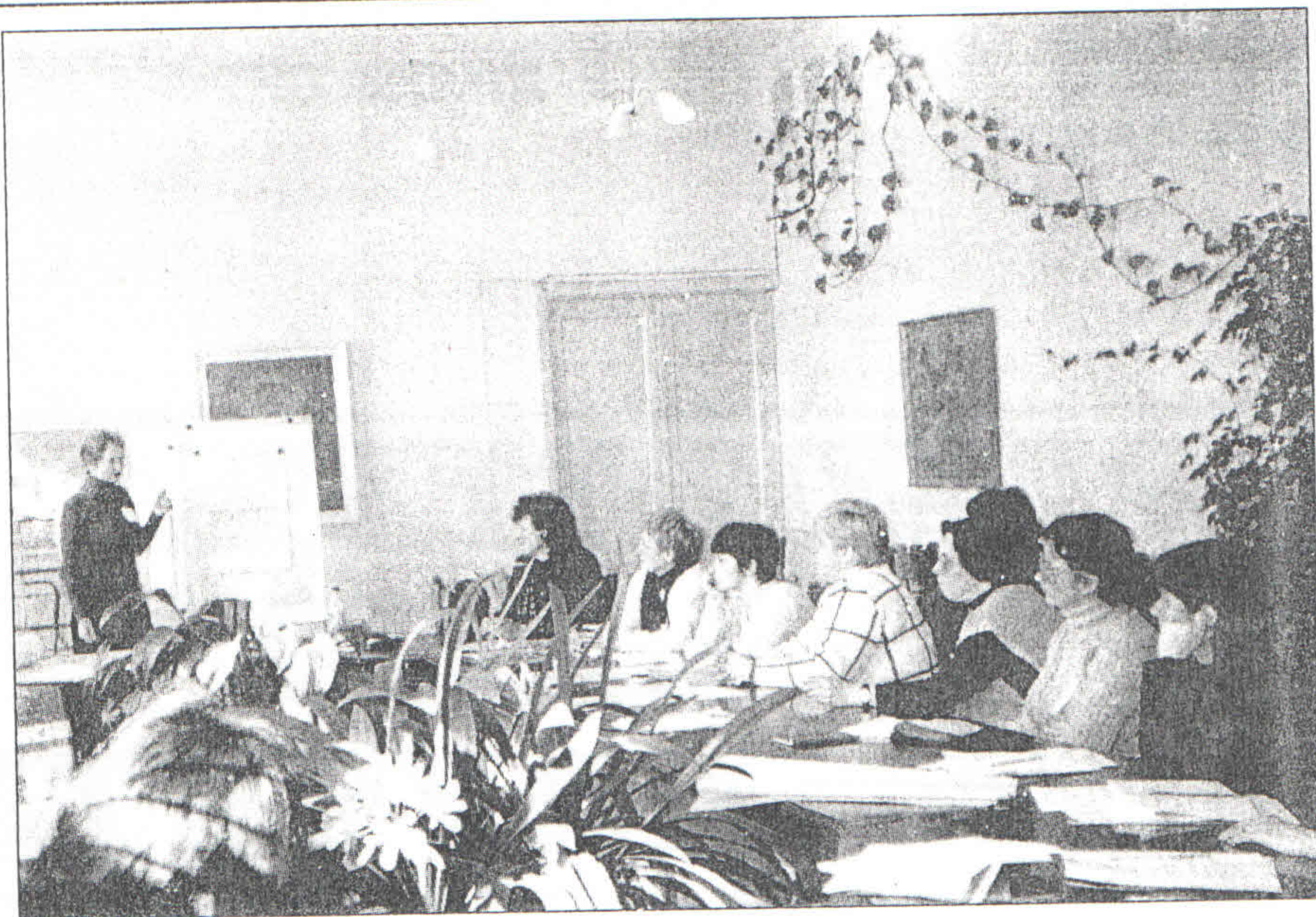
Идет защита проектов в областном тренинг-центре

ряде его тренингов побывали и наши специалисты.