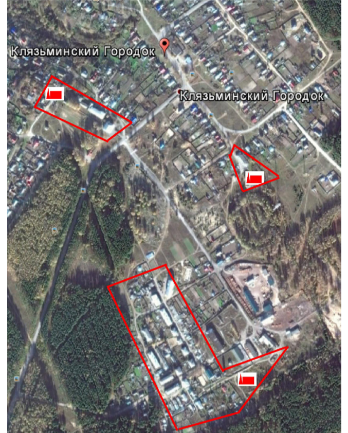
Рисунок 3.2.1 - Схема теплового района №1 с. Клязьминский Городок

Зоны расположения источников теплоснабжения Клязьминского сельского поселения представлены на рис. 3.2.1-3.2.4.