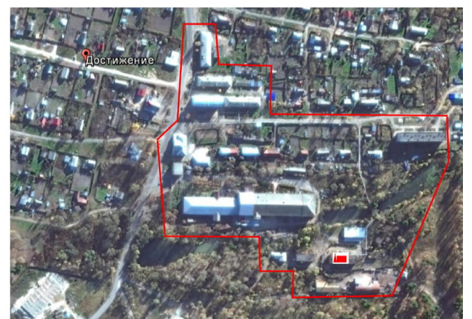
Рисунок 3.2.3 - Схема теплового района №3 п. Достижение