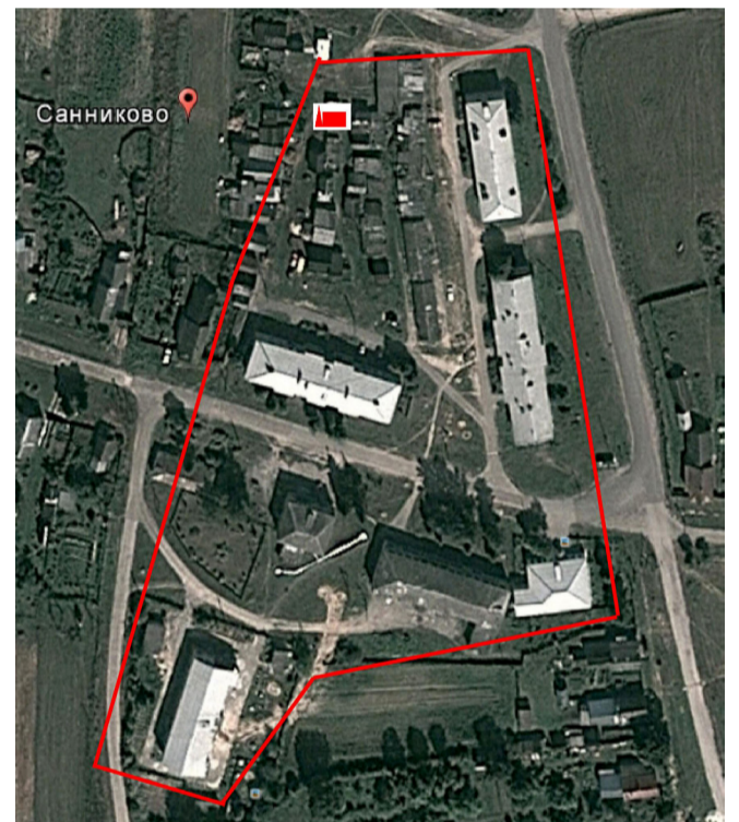
Рисунок 3.2.2 - Схема теплового района №2 с. Санниково