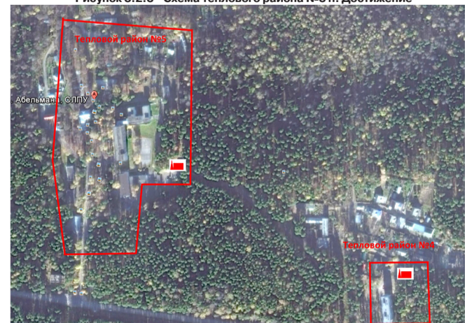
Тепловой район №4