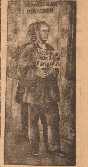
На снимке: На улицах Вены безработный держит перед собой объявление: «Голодаю, ишу работу».

В Берлине, Нью-Йорке, Риме, Лондоне во всех городах капиталистических стран стоят на улицах истощенные люди, держа перед собой объявления: «Голодаю, ишу работу», «согласен на любые условия» и т. д. и т. п. Это безработные.