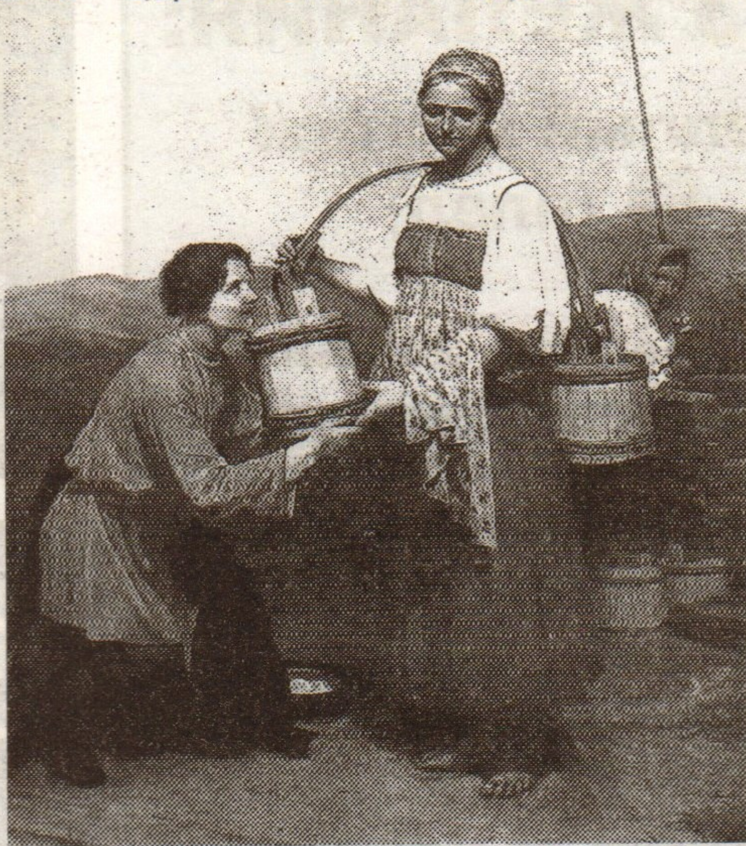
Коромысло — непременный атрибут многих произведений классической живописи. Например, картины Алексея Венецианова «Встреча у колодца», написанной в 1843 году

До губернской реформы 1778 года Коромыслово входило в состав Владимирского уезда, а потом было включено в новообразованный Ковровский уезд. В начале 1860-х гг. это селение оказалось в пределах Всегодичской волости, причем отсюда до волостного центра в селе Большие Всегодичи требовалось преодолеть расстояние в 8 верст в один конец. По церковной линии деревня