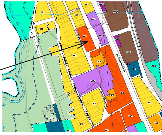
О внесении изменений и дополнений в Устав муниципального образования Ивановское сельское поселение Ковровского района Владимирской области

В целях приведения Устава муниципального образования Ивановское сельское поселение Ковровского района Владимирской области в соответствие с требованиями федерального законодательства, Совет народных депутатов решил: